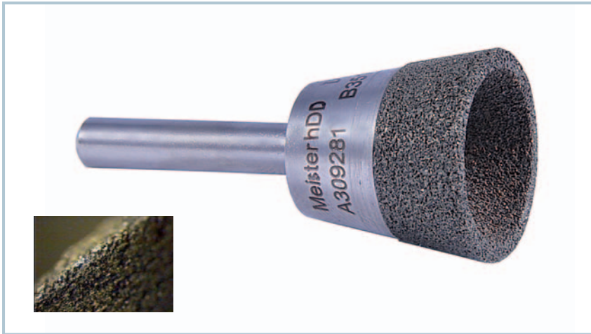
4 Konischer DC in hDD-Technologie mit poröser Struktur