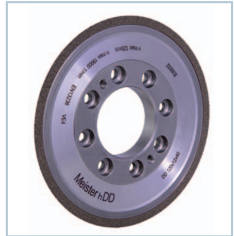
5 Das Abrichten von Außenrundscheifscheiben mit dem hDD-Abrichtwerkzeug DD120×12×40 X=5 W=2 D42-426-175-H* erbrachte eine Verkürzung der Prozessdauer um 30 Prozent

■ Prozessdauer: um 30 Prozent verkürzt. Eine dritte Anwendung ist das Abrichten von Ceralox-Bohrungsschleifscheiben mit folgenden Kennwerten und Ergebnissen: