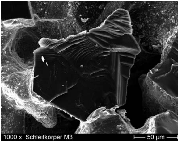
3 Der Bruch einer hDD-Struktur ist in der Regel mit einem Splittern des Diamantkorns verbunden, nicht aber mit Delaminationen an den Grenzflächen Matrix/Korn

teile einer porösen Matrix mit einer signifikant verbesserten Verschleißfestigkeit. Inzwischen sind diese Werkzeuge als sogenannte hDD-Abrichter (hybrid Diamond Dresser) am Markt etabliert.